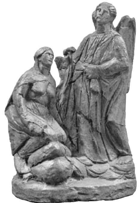
Ο Ευαγγελισμός, του Γιαννούλη Χαλεπά

Συνεχίζεται η Έκθεση γλυπτών και σχεδίων του Τηνιακού Γιαννούλη Χαλεπά , στην Εθνική Γλυπτοθήκη Αθηνών, που βρίσκεται στο Άλσος Στρατού στο Γουδί και έχει είσοδο από την Λεωφόρο Κατεχάκη. Εκτίθενται έργα του μεγάλου Έλληνα καλλιτέχνη, από την νεανική του ζωή και την εποχή μετά την επάνοδό του από το ψυχιατρείο, λόγω ασθένειάς του, στον Πύργο της Τήνου.