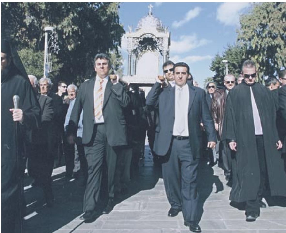
Φωτογραφία: Το φωτογραφείο

« Χ αίρε Κεχαριτωμένη σου Κύριος μετά σου Ευλογημένη συ εν Γυναιξί...»