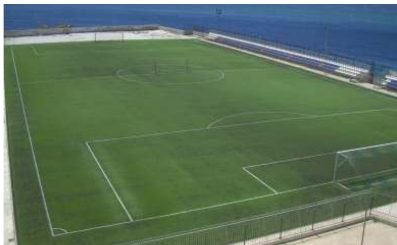
Το Δημοτικό γήπεδο Τήνου

της Μυκόνου. Το αποτέλεσμα, 1 - 0, υπέρ της "Ελλάς". Οι Τηνιακοί διαμαρτυρήθηκαν και θεώρησαν άδικο το αποτέλεσμα. Οι Συριανοί το θεώρησαν δίκαιο. Για την ιστορία να